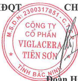
Đoàn Hải Mậu